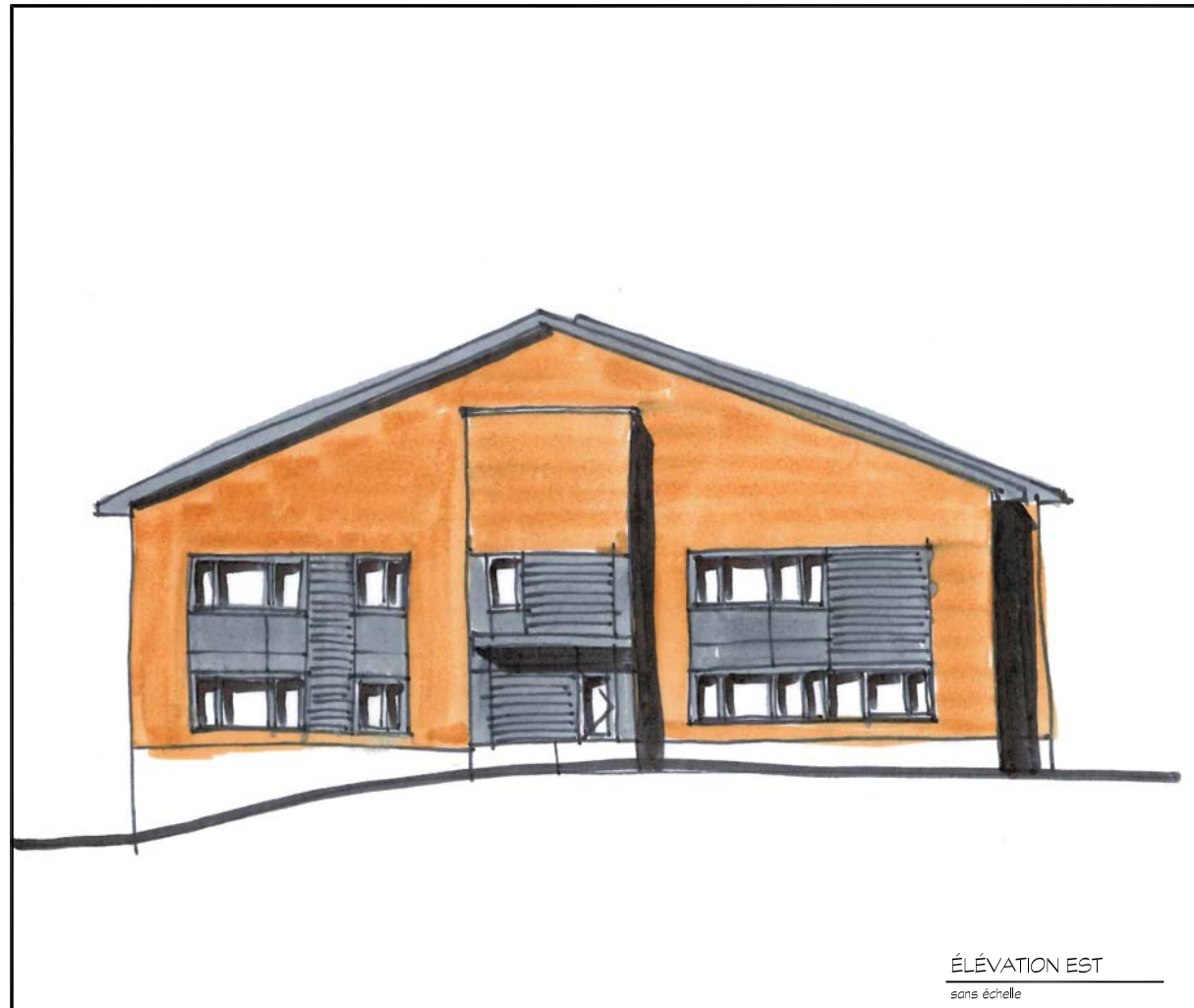
ÉLEVATION EST sans échelle