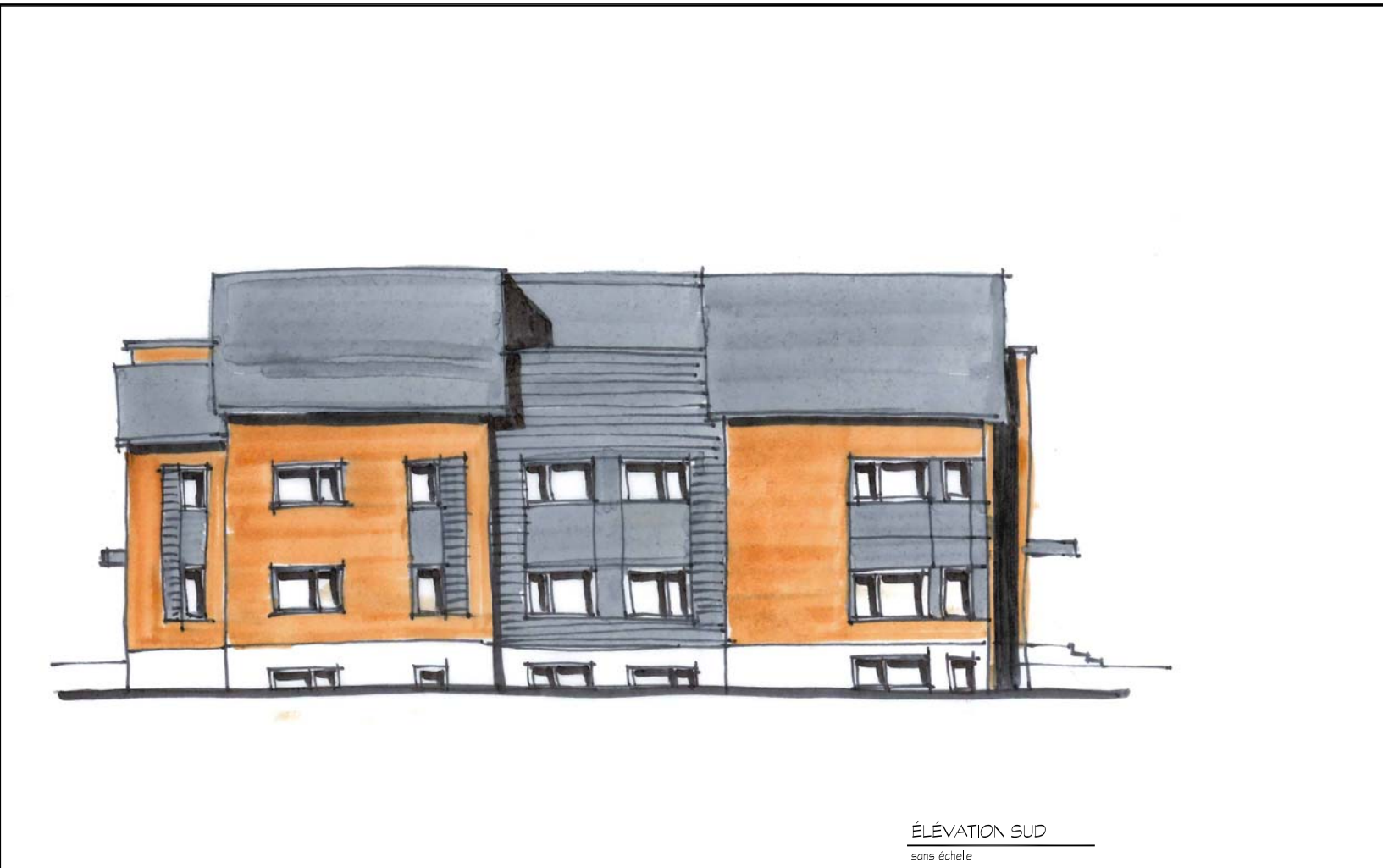
ÉLEVATION SUD sans échelle