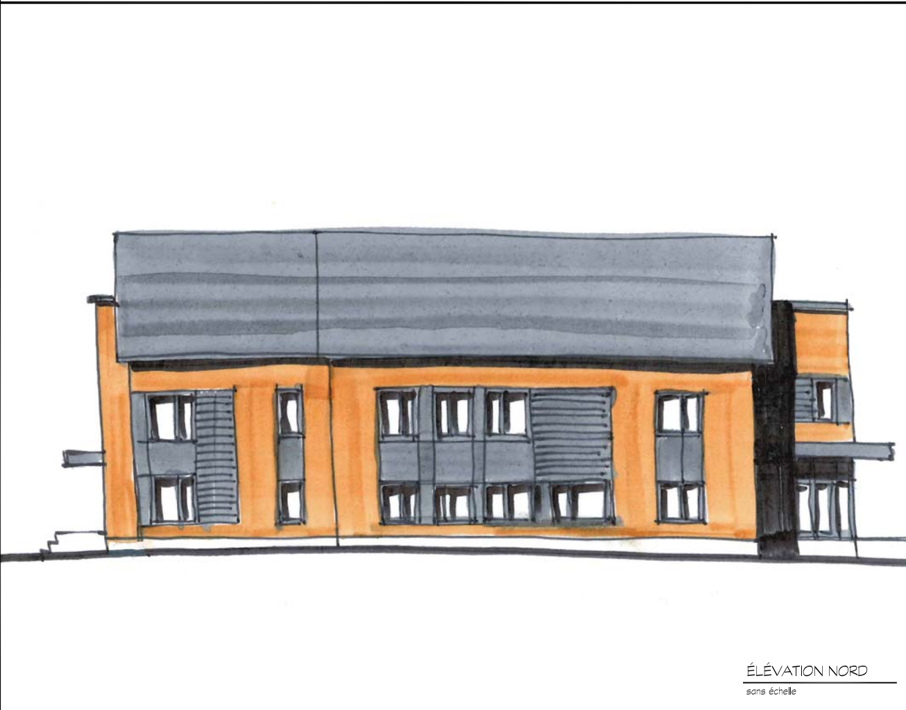
ÉLEVATION NORD sans échelle